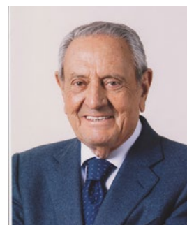
Américo Ferreira de Amorim

Empresário dinâmico, grande empreendedor, marcou o rumo da Galp, onde foi Presidente do Conselho de Administração desde Abril de 2012 a Outubro de 2016.